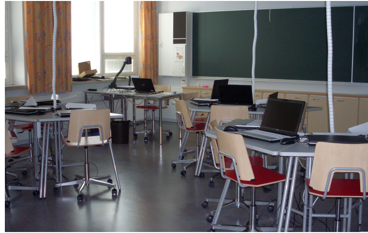
Yritysjattelun mukainen uusittu luokkahuone.