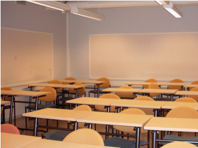
Luokkatila ennen uudistusta.

Yritysjattelun kautta pyrimme siihen, että opiskelijat ottavat enemmän vastuuta omasta tekemisestään. Jokaiselle ryhmälle valitaan toimitusjohtaja, jonka ”vastuulla” ryhmän työnteke on. Jos joku työntekijä ei tule töihin, johtaja soittaa perään. Samalla korostetaan vastuuta ryhmän työstä, jokaisella on joku tehtävä ja jos sitä ei tee, muut joutuvat sen tekemään. Tämän toiminnan avulla pyrimme sitouttamaan opiskelijat koulutukseen entistä paremmin.